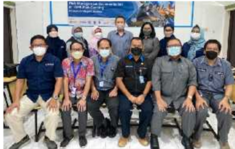
Gambar 1. Kegiatan Pelatihan Penyusunan SOP Higiene dan Sanitasi Tefa Canning Polije