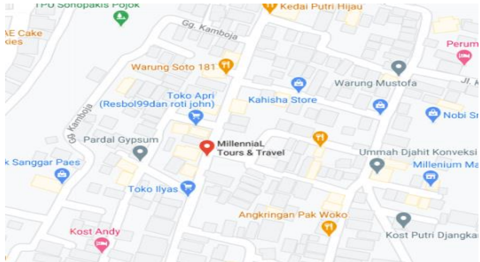
Gambar 1. 1 Peta Lokasi Kantor CV.Millennial Tour & Travel