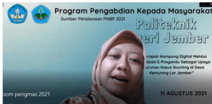
Gambar 2. Pengantar Data Posyandu (Stunting) Dari Tim Pengabdian

Pada sesi kedua, salah satu tim pengabdian juga menjelaskan bahwa dengan memanfaatkan aplikasi eposyandu, maka kader nantinya dapat dengan mudah mengelola laporan posyandu terutama untuk deteksi dini stunting. Karena pada sistem sudah ditambahkan perhitungan secara matematis sehingga kader tidak perlu menghitung manual lagi.