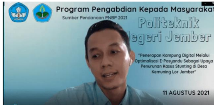
Gambar 1. Pengantar Eposyandu Dari Tim Pengabdian

Dalam kegiatan pengabdian masyarakat ini, hasil kegiatan berupa pelatihan pemanfaatan aplikasi eposyandu kepada seluruh kader Manggis 15 dan Manggis 18 yang dilaksanakan secara daring (Zoom) pada tanggal 11 Agustus 2021 dengan uraian dokumentasi kegiatan sebagai berikut :