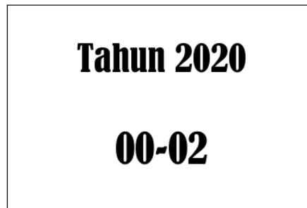
Gambar 1. Media Informasi Pada Rak Penyimpanan