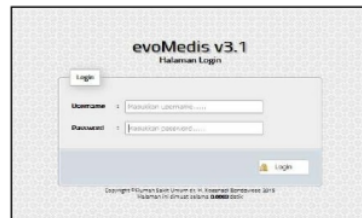
Gambar 3 Tampilan menu login SIMRS