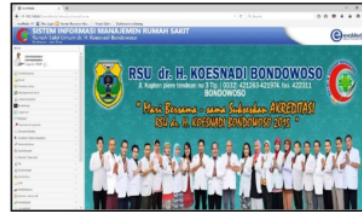
Gambar 1 Tampilan halaman utama SIMRS

terdapat pada tiap unit pelayanan yang menggunakan SIMRS.