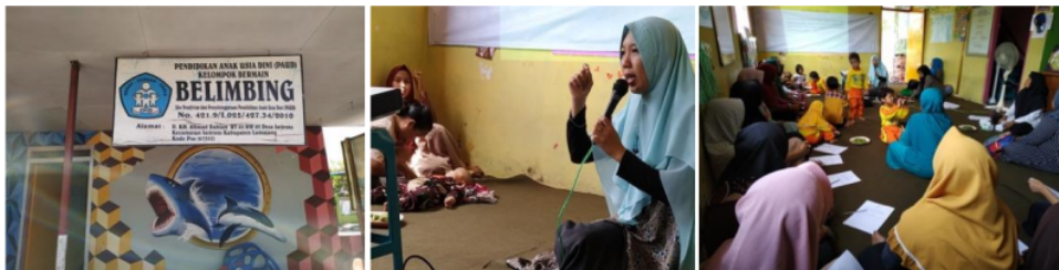
Gambar 2. PAUD Belimbing dan kegiatan penyuluhan mengenai tumbuh kembang anak

Hasil kegiatan menunjukkan bahwa sebagian besar peserta yaitu orang tua siswa PAUD Belimbing belum mengetahui secara detail mengenai tahapan perkembangan anak dan cara stimulus yang benar dan tepat dalam mendukung pertumbuhan optimal anak. Setelah diberikan penyuluhan peserta memahami mengenai tahapan tumbuh kembang dan menentukan stimulus yang baik untuk mendukung pertumbuhan optimal anak-anaknya.