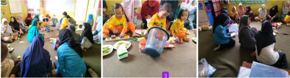
Gambar 3. Kegiatan praktik peningkatan kemampuan orang tua dalam pemahaman tumbuh kembang anak.

3. Penegakkan diagnosis dini setiap kelainan tumbuh kembang untuk mendapatkan penanganan dengan efektif serta mencari penyebab dan pencegahannya.