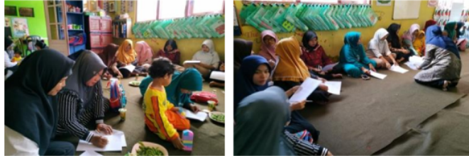
Gambar 4. Kegiatan evaluasi pemahaman dari peserta mengenai materi yang diberikan.

disampaikan dengan praktek dan lisan. Dari hasil evaluasi yang dilakukan yaitu orang tua memiliki pengetahuan yang baik terhadap tumbuh kembang balita. Sebelum kegiatan dilakukan orang tua tidak mengetahui dan kurang memahami tumbuh kembang anak setelah kegiatan dilakukan pengetahuan orang tua mengenai tumbuh kembang anak lebih baik, sehingga diharapkan orang tua mampu mengaplikasikan ilmu yang diperoleh dalam kehidupan sehari-hari dan menyebarkan ilmu tersebut kepada teman, saudara, dan masyarakat sekitarnya.