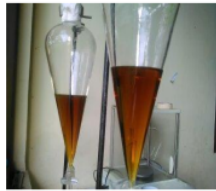
Gambar 3 Hasil Reaksi Transesterifikasi

Proses pengadukan dihentikan dan campuran dituangkan pada corong pemisah dengan membiarkannya selama ± 8 jam hingga terbentuk dua lapisan yang terdiri dari produk biodiesel dan gliserol dimana produk utama biodiesel terletak pada lapisan atas berwarna kecoklatan dan gliserol sebagai produk samping terletak pada bagian bawah