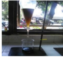
Gambar 2 Hasil Reaksi Esterifikasi