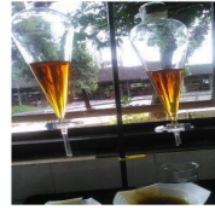
Gambar 4 Hasil Proses Pencucian

Pemurnian biodiesel dilakukan untuk menghilangkan sisa-sisa dari katalis dan gliserol yang masih terkandung pada produk biodiesel. Konsentrasi magnesium yang digunakan yaitu 1 dan 1,5% . menurut Wisesa (2015) rendemen terbaik pada proses pencucian dry washing menggunakan 1,5% magnesium silikat dengan menghasilkan rendemen 89,3% dengan waktu pencucian selama 30 menit [3]. Menurut Darmawan (2013) Penggunaan prosentase magnesol 1% dari berat biodiesel minyak jelantah hasil proses pencucian Dry-wash adalah yang paling baik dari segi karakteristiknya [4].