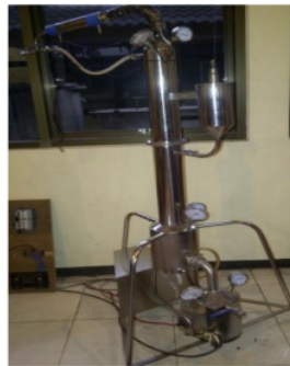
GAMBAR 1. ALAT DISTILASI REKTIFIKASI YANG TELAH DIBUAT

Kapasitas alat tersebut adalah 3 liter bahan masukan dan terdiri dari komponen penting yaitu reboiler, kolom bawah, kolom tray, kondensor, pipa pendingin dan tangki penampung distilat.