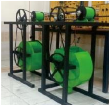
Gambar 7. Mikrohidro dengan turbin cross-flow

permanen sehingga menghasilkan energi listrik. Turbin air cross flow dibuat dari bahan plat besi yang terdiri dari 12 (dua belas) sudut dengan diameter 60 cm, poros turbin diletakkan pada rangka pipa besi yang didesain secara portabel dan menyatu dengan generator DC magnet permanen seperti ditunjukkan Gambar 6. Selanjutnya dilakukan perakitan turbin air cross flow dan generator DC magnet permanen yang ditempatkan pada rangka pipa besi yang didesain portable kemudian dipasang pulley , sedangkan untuk menghubungkan turbin air cross flow dan generator dipasang vanbelt seperti ditunjukkan Gambar 7.