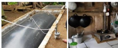
Gambar 10. Biogas komunal Dusun Lanasan

Tahap kelima yaitu instalasi saluran gas pada dapur rumah warga Dusun Lanasan. Pemasangan saluran gas pada kompor gas dilengkapi dengan pompa pendorong untuk memperkuat aliran gas yang masuk karena bertekanan rendah dan dilengkapi switch pengaman untuk buka tutup gas seperti ditunjukkan Gambar 10.