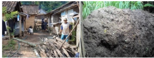
Gambar 1. Lingkungan Dusun Lanasan: a) rumah tanpa aliran listrik; b) penumpukan limbah kotoran ternak

atau dibiarkan saja di pekarangan rumah atau ditempatkan di lubang galian sehingga pekarangan atau kandang sapi terlihat kotor, mengundang vektor penyakit (lalat, nyamuk), menimbulkan bau gas amonia dan menyebarkan bau tidak sedap seperti ditunjukkan Gambar 1(b). Pendapatan warga yang bergantung dari upah memetik teh dan pembagian sisa hasil tiket masuk agrowisata Gunung Gambir yang berbagi dengan PTPN XII sebagai pemilik lahan tidak sepadan dengan pemenuhan kebutuhan rumah tangga sehari-hari seperti memasak yang masih menggunakan kayu bakar, pemakaian elpiji mahal dan sulit mendapat pasokan.