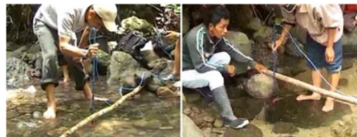
Gambar 4. Pengukuran debit aliran air

kelompok warga Dusun Lanasan. Pembahasan FGD meliputi pemaparan metode pelaksanaan kegiatan, rentang waktu pengerjaan, pengukuran potensi mikrohidro dan lokasi PLTMH, konstruksi bangunan sipil, pembuatan perangkat mikrohidro dan power-house , dan instalasi listrik. Untuk pengukuran potensi mikrohidro dilakukan survei lapangan di sepanjang aliran sungai Dusun Lanasan dan dilakukan dua kali pengukuran potensi mikrohidro saat debit aliran sungai tinggi dan sebaliknya. Pengukuran potensi mikrohidro dilakukan di lokasi rencana bendungan dan saluran penyalur air ke mikrohidro menggunakan current meter flow merk Mini-Air 20 seperti ditunjukkan Gambar 4, dimana pengukuran dilakukan secara melintang lebar sungai dengan kontur homogen sepanjang 0,8 m yang dibagi menjadi empat segmen per 0,2 meter. Hasil pengukuran dicatat pada lembar pencatat data seperti ditunjukkan Tabel 1 yang berisi jarak antar bagian (S) dalam satuan meter, kedalaman kincir (K) dari current meter flow dalam satuan meter yang diukur pada separuh kedalaman air sungai, luas permukaan per tahap (L) dalam satuan m^2 , kecepatan rata-rata debit aliran air (V) dalam satuan m/s dari tiga kali pengukuran per tahap, dan debit aliran sungai (D) per tahap dalam satuan m^3/s . Dari hasil pengukuran didapatkan total debit aliran air sebesar 0,0707 m^3/s yang digunakan sebagai parameter penentu lebar dan runner turbin cross-flow untuk menghasilkan luaran daya listrik yang maksimal.