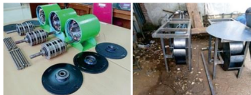
Gambar 6. Pembuatan generator mikrohidro dan turbin cross-flow

Pada tahap ini, pembuatan perangkat mikrohidro yang harus dilakukan lebih dahulu yaitu membuat generator mikrohidro dengan pengadaan rotor generator magnet permanen dan dirakit menjadi rotor dengan jumlah 6 (enam) buah kutub magnet permanen kemudian dipasang poros. Selanjutnya membuat rumah stator generator dari pipa besi ukuran diameter 5 dim dipotong disesuaikan dengan panjang rotor generator. Rumah stator generator adalah tempat meletakkan lilitan kumparan kawat yang terdiri dari 6 (enam) buah kumparan disesuaikan dengan besar diameter pipa besi. Agar generator tidak kena percikan air dari turbin air waktu berputar, maka didesain diberi tutup disisi depan dan disisi belakang generator kemudian dirapatkan dengan 3 (tiga) buah mur baut panjang seperti ditunjukkan Gambar 6. Selanjutnya dilakukan pengujian laboratorium untuk mengetahui kinerja dari generator DC magnet permanen sebelum dirakit dengan turbin air mikrohidro dan diterapkan di sungai yang berada pada lokasi mitra, tujuannya untuk mengetahui besar tegangan terendah sampai tertinggi apabila diputar menggunakan motor yang diputar dengan kecepatan (rpm) yang bervariasi tanpa dibebani, kemudian diuji lagi dengan variasi kecepatan yang sama dengan dibebani lampu penerangan LED.