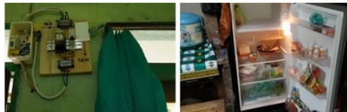
Gambar 9. Hasil instalasi listrik Dusun Lanasan

Pada tahap awal ini dilakukan pemasangan saluran listrik ke tujuh rumah warga Dusun Lanasan dengan memasang tiang-tiang penyangga listrik, pemasangan MCB ( miniature circuit breaker ), dan dilakukan uji coba dengan menyalakan semua lampu, lemari pendingin, dan televisi seperti ditunjukkan Gambar 9.