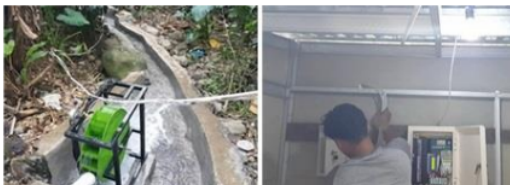
Gambar 8. Pemasangan mikrohidro dan sinkronisasi aliran listrik dari tiga mikrohidro