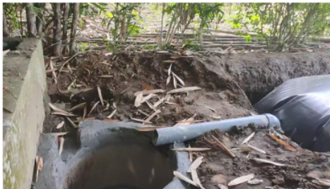
Gambar 6. Bak penampungan slurry

Bak penampungan outlet dibuat dari buis beton dengan ukuran diameter 70 cm dengan ukuran diameter 70 cm dengan tinggi 160 cm yang ditanam di dalam tanah. Bak penampungan ini berfungsi untuk menampung limpahan slurry yang sudah tidak mengandung biogas dari hasil fermentasi kotoran ternak dalam digester biogas. Saluran outlet menghubungkan antara lubang keluaran digester biogas dengan bak penampung outlet ini seperti ditunjukkan pada Gambar 6. Slurry yang ditampung dalam bak ini merupakan pupuk organik cair yang dapat digunakan sebagai penyubur/ penambah unsur hara untuk pertanian.