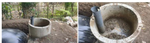
Gambar 4. Bak penampungan slurry dan saluran inlet biogas

penampungan slurry dan saluran inlet ditunjukkan pada Gambar 4. Sebelum slurry disalurkan ke dalam digester, dilakukan pengadukan campuran antara limbah cair tahu-tempe dan kotoran sapi dengan perbandingan 2 : 1 (2 limbah c 8 tahu-tempe : 1 timba limbah kotoran sapi). Pengisian awal dilakukan sampai batas optimal lubang pengeluaran ( outlet ) atau kotoran diisi 60% dari kapasitas volume digester biogas.