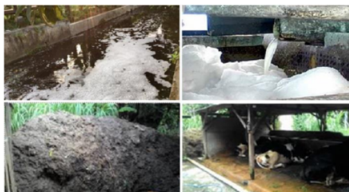
Gambar 2. Pencemaran limbah tahu-tempe di aliran sungai dan penumpukan kotoran sapi

1) mahal nya harga bahan baku kedelai; 2) langka dan mahal nya harga minyak goreng untuk produksi tahu goreng; 3) bahan bakar produksi sangat tergantung pada pembelian bongkol jagung kering atau kayu bakar yang lebih mahal. Selain itu, produksi tahu-tempe menghasilkan limbah cair \pm 5600 liter per minggu dimana memiliki warna, busa, endapan, bau yang sangat menyengat dan pengrajin tahu-tempe belum memiliki sistem daur ulang limbah sehingga langsung dibuang ke aliran sungai yang menimbulkan polusi bau dan menjadi vektor penyakit seperti ditunjukkan Gambar 2. Selain itu, pengrajin tahu-teme Dusun Glagasan banyak juga memiliki sapi dan bekerja sampingan sebagai petani. Dari 32 sapi yang dimiliki menghasilkan kotoran sapi \pm 800 kg per-hari dimana limbahnya hanya ditumpuk atau dibiarkan saja di pekarangan rumah/kandang atau ditempatkan di lubang galian sehingga terlihat kotor, menjadi sumber penyakit, dan menyebarkan bau tidak sedap.