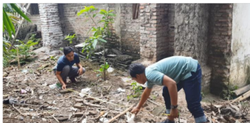
1 Gambar 3. Pemilihan lokasi biogas

Berdasarkan hasil diskusi antara tim pelaksana dan mitra disepakati penyediaan lahan untuk pembangunan instalasi biogas pada mitra diletakkan di belakang tempat produksi tahu-tempe dan berdekatan dengan kandang sapi dimana pemilihan lokasi ini bertujuan memudahkan pemasukan limbah cair tahu-tempe dan kotoran sapi ke bak penampungan biogas ( inlet ) seperti ditunjukkan Gambar 3.