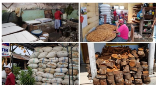
Gambar 1. Pengrajin tahu-tempe Desa Rowotamtu: (a) proses produksi; (b) kebutuhan bahan bakar produksi

Kecamatan Rambipuji merupakan salah satu sentra agroindustri tahu-tempe terbesar di wilayah Jember dengan jumlah pengrajin tahu-tempe sebanyak 92-unit usaha. Salah satu wilayah di Kecamatan Rambipuji yang merupakan sentra agroindustri tahu-tempe terletak di Dusun Glagasan, Desa Rowotamtu yang memiliki 20 pengrajin tahu-tempe yang memperkerjakan hampir 5-6 orang masyarakat lokal per pengrajin dan tergabung dalam Kelompok Pengrajin Tahu-Tempe Mekar Jaya. Area pemasaran produk tahu-tempe Kelompok Mekar Jaya meliputi Pasar Rambipuji, Pasar Balung, Pasar Mangli, Pasar Ajung, Pasar Jenggawah, Pasar Bangsar, Pasar Ambulu, Pasar Tanjung, dan sebagian kecil dipasarkan secara langsung keliling kampung atau desa-desa. Setiap pengrajin tahu-tempe rata-rata menghabiskan \pm 5 -8 ton kedelai dan \pm 280 -liter air per minggunya untuk produksi tahu-tempe seperti ditunjukkan Gambar 1(a). Sedangkan bahan bakar produksi tahu-tempe biasanya menggunakan bongkol jagung kering atau kayu seperti ditunjukkan Gambar 1(b). Kebutuhan bongkol jagung mencapai \pm 300 -400 karung per minggu yang dipasok dari penjual luar dengan harga Rp. 8.500,- sampai Rp 10.000,- per karung. Sedangkan kebutuhan minyak goreng yang digunakan oleh pengrajin tahu dalam membuat tahu goreng di Desa Rowotamtu menghabiskan \pm 300 liter per hari dengan biaya yang dikeluarkan mengikuti harga minyak di pasar.