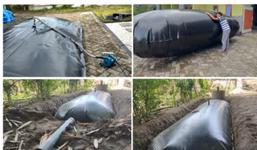
Gambar 5. Instalasi digester balon pada mitra

Pembuatan dan instalasi digester balon ditunjukkan Gambar 5, dimana ukuran 11 digester balon yang digunakan memiliki panjang 8 m 1 er, lebar 1.8 meter dan tinggi 1.8 meter dengan daya tampung 1500 liter. Digester ini ditanam dalam tanah dengan membuat rumah galian berbahan batu bata. Hal ini dimaksudkan agar kelihatan tidak terlalu mengambil ruang serta lebih mudah dalam memasukkan slurry ke dalam digester. Dengan demikian, slurry yang ditampung pada bak penampungan akan secara mudah mengalir ke dalam digester melalui saluran inlet karena posisi digester lebih rendah dari lubang pemasukan.