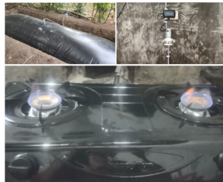
Gambar 7. Instalasi saluran biogas pada mitra

Untuk menghasilkan pupuk organik yang kaya mikroba Probiotik dapat dibuat dengan mencampur slurry basah atau cair dengan aneka bahan organik lain seperti air kencing sapi, kambing/domba yang kaya nutrisi nitrogen (N) dan hormon pertumbuhan, air kelapa yang kaya hormon pertumbuhan, ragi sebagai sumber vitamin B dan mikroba pengomposan, serta sumber energi seperti molase (tetes tebu), gula pasir atau gula merah [7]. Pelatihan dan pendampingan dalam pemanfaatan pupuk organik ditunjukkan Gambar 8.