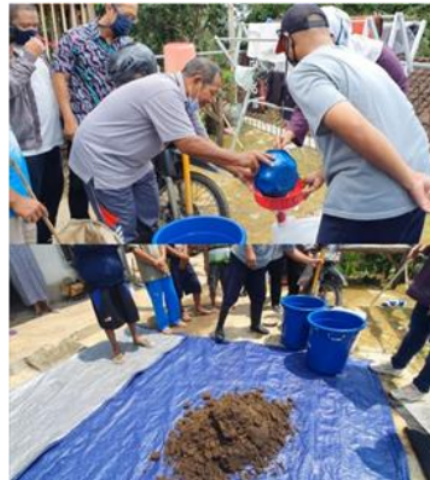
Gambar 8. Pelatihan pembuatan pupuk organik