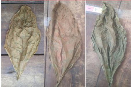
Gambar 3. Warna Daun Tembakau

Warna daun umumnya merupakan unsur dalam kualitas tembakau yang merupakan kesan pertama yang dapat mewakili kualitas dari daun tembakau tersebut. Warna daun mewakili unsur kualitas yang ada didalam tembakau tersebut seperti kandungan gula, protein dan lain-lain [3].