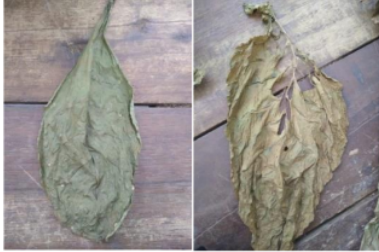
Gambar 2. Cacat Daun Tembakau

karena pada kualitas daun tembakau ini terdapat beberapa kondisi daun yang kurang baik. Pada hasil penelitian ini terdapat beberapa macam kecacatan pada daun tembakau yaitu : penyakit patik atau tol-tol (spikkel) dan trip [7]. Berikut adalah gambar dari kecacatan daun.