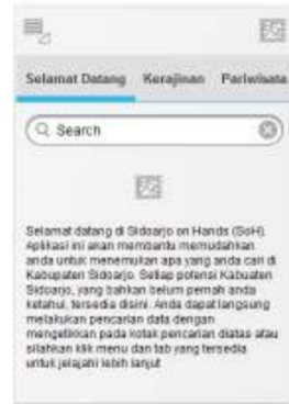
Gambar 3. Welcome screen

Pada saat SoH dijalankan, maka tampilan awal sistem seperti pada gambar 3 diatas. Rancangan desain welcome screen memuat informasi singkat tentang SoH dan bagaimana cara menjalankan sistem SoH tersebut. Kotak pencarian dapat digunakan oleh pengguna SoH untuk mencari informasi secara umum yang terdapat dalam SoH.