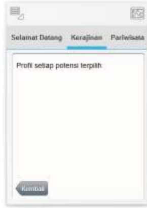
Gambar 6. Rancangan form untuk setiap profil potensi terpilih

Pada gambar 5 akan dimunculkan informasi marking posisi untuk setiap potensi yang ada sesuai dengan sub kategori potensi yang telah dipilih oleh pengguna SoH pada form sebelumnya. Pada setiap node akan dimunculkan nama dari setiap potensi yang terdapat di Kabupaten Sidoarjo. Jika pengguna SoH memilih salah satu potensi yang ada, maka profil dari setiap potensi terpilih akan ditampilkan pada form selanjutnya seperti terlihat pada gambar 6.