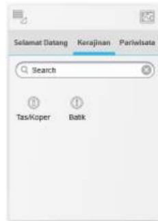
Gambar 4. Rancangan desain form untuk setiap pilihan kategori potensi

Pada saat SoH dijalankan, maka tampilan awal sistem seperti pada gambar 3 diatas. Rancangan desain welcome screen memuat informasi singkat tentang SoH dan bagaimana cara menjalankan sistem SoH tersebut. Kotak pencarian dapat digunakan oleh pengguna SoH untuk mencari informasi secara umum yang terdapat dalam SoH.