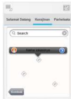
Gambar 5. Rancangan desain form untuk setiap pilihan sub kategori potensi

Gambar 4 menampilkan rancangan form utama pada SoH. Setiap kategori utama yang terdapat dalam SoH ditampilkan dalam bentuk tab . Setiap tab akan memunculkan sub kategori dari setiap kategori potensi terpilih dalam bentuk mini icon . Kotak pencarian dapat digunakan oleh pengguna SoH untuk mencari informasi sesuai dengan kategori potensi terpilih yang terdapat dalam SoH. Jika pengguna SoH memilih salah satu sub kategori potensi yang ada, maka pengguna SoH akan menuju tampilan form berikutnya seperti terlihat pada gambar 5.