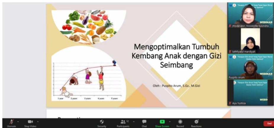
Gambar 1. Sesi Penyampaian Materi

Penyuluhan diselenggarakan secara daring melalui platform zoom meeting. Pemberian materi dilakukan dengan metode ceramah, diskusi dan tanya jawab. Sebanyak 20 ibu anggota KMHM mengikuti kegiatan ini