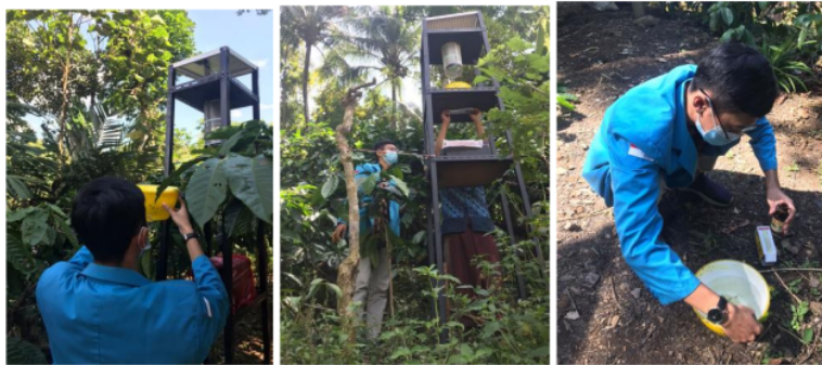
Gambar 3. Monitoring Kinerja Alat Penjebak Serangga

Pelaksanaan kegiatan pengabdian kepada masyarakat (PKM) yang telah dilakukan selama 3 bulan menunjukkan adanya kebermanfaatan program setelah dilakukan implementasi alat penjebak serangga tenaga surya. Berikut ini merupakan hasil kuesioner yang ditampilkan pada Gambar 4.