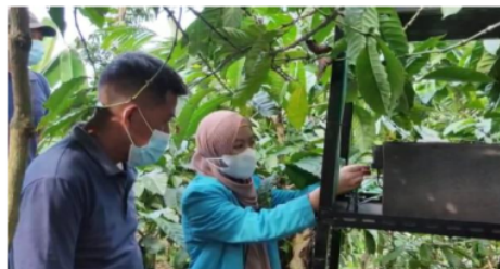
Gambar 2. Pendampingan Penggunaan dan Uji Coba Alat Penjebak Serangga