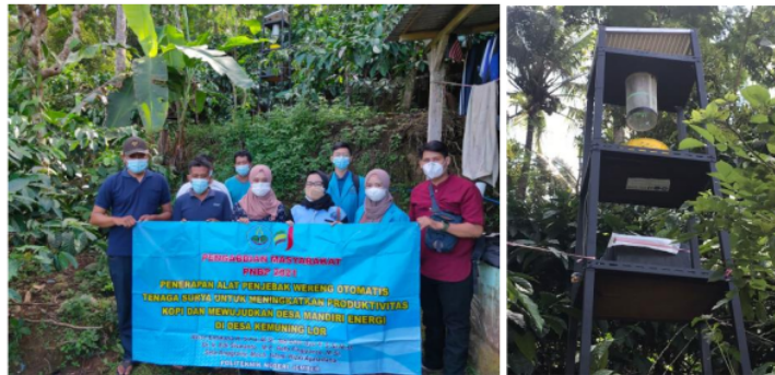
Gambar 1. Implementasi 2 buah Alat Penjebak Serangga di Perkebunan Kopi Dusun Rayap Desa Kemuning Lor

Penerapan 2 buah alat penjebak serangga di perkebunan kopi kelompok tani Dusun Rayap Desa Kemuning Lor telah dilakukan dengan menerapkan protokol kesehatan Covid-19 seperti pada Gambar 1. Kegiatan ini dihadiri oleh 7 orang petani kopi, 3 dosen dan 2 mahasiswa Politeknik Negeri Jember. Pendampingan dan uji coba alat telah dilakukan untuk memberikan penjelasan kepada mitra petani terkait cara penggunaan alat dan sekaligus menguji kinerja alat sebelum digunakan seperti pada Gambar 2. Hasil uji coba menunjukkan total kebutuhan energi alat penjebak serangga 42,618 Wh/hari dan mampu menyala 11 jam, serta mampu menjebak serangga yang masuk dalam baskom yang berisi air.