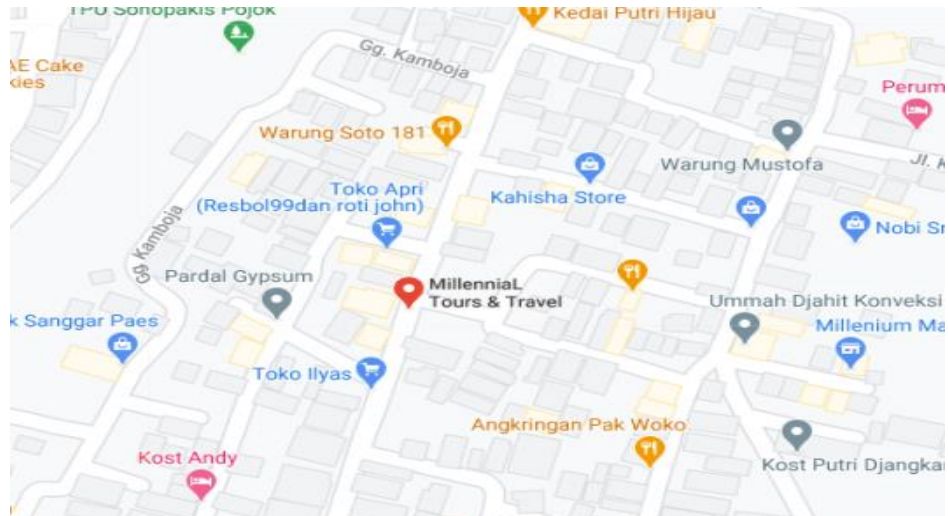
Gambar 1. 1 Peta CV. Millennial Tour and Travel