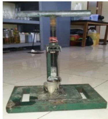
Gambar 1. Alat Pengempa (Pengepres Briket)

Bahan penelitian yang digunakan untuk membuat briket adalah kulit kacang tanah yang diambil dari limbah pembuatan kacang telur yang berada di Desa Jatikalang, Kabupaten Sidoarjo, sedangkan biji nangka yang digunakan diambil dari area sekitar Desa Jatikalang, Kabupaten Sidoarjo.