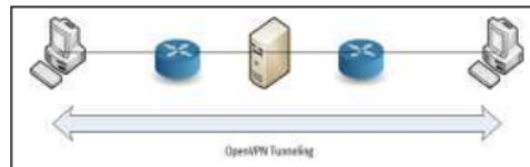
Gambar 3. Model tunneling OpenVPN

Dalam melakukan tunneling, OpenVPN membuat virtual address yang berbeda dengan IP address. Pada penelitian ini IP Address yang digunakan 192.168.0.2 pada user 1 dan 192.168.0.2 pada user 2. Sedangkan virtual address yang dibuat 10.8.0.6 pada user 1 dan 10.8.0.10 pada user 2. Virtual address digunakan untuk mengirimkan packet melalui tunnel. Model tunneling OpenVPN ditunjukkan pada gambar 2.