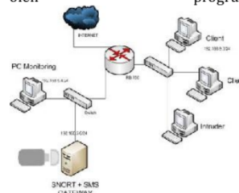
Gambar 2 Topologi sistem

Snort sebagai sistem deteksi intrusi pada jaringan menggunakan SMS Gateway adalah sistem yang dibuat dengan tujuan memberikan notifikasi peringatan kepada admin apabila terjadi pencatatan sebuah event alert, sehingga admin dapat melakukan tindakan berdasarkan jenis alert yang teridentifikasi oleh program snort