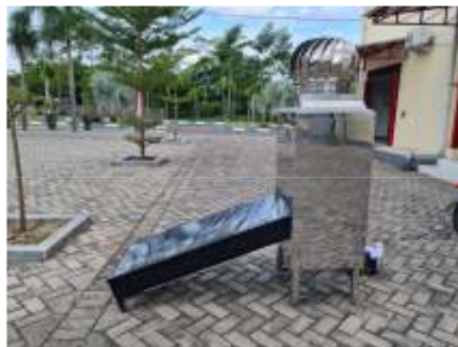
Gambar 1. Alat Pengering Hybrid

Petani kopi rakyat tidak memiliki pengetahuan dan teknologi mengenai proses produksi kopi yang baik, sehingga kualitas kopi yang dihasilkan kurang cukup bagus yang membuat harga kopi rakyat memiliki nilai jual yang rendah. Petani kopi rakyat selama ini pada proses pengeringan kopi hanya menggunakan pengeringan tradisional, diharapkan dengan adanya alat pengering hybrid ini dapat membuat kualitas kopi rakyat menjadi lebih baik.