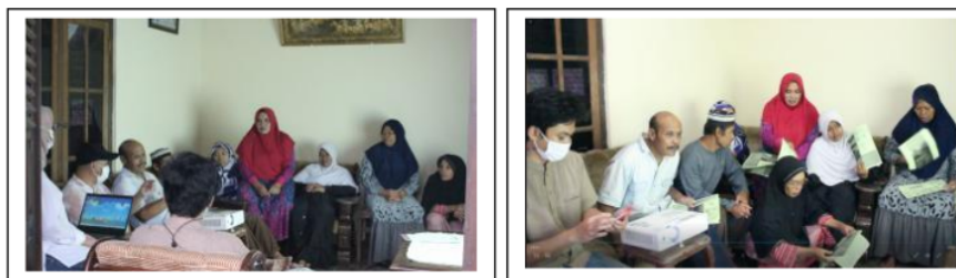
Gambar 4. Pelatihan Penguasaan Pengelolaan dan Pemasaran Homestay

Pelatihan yang dilaksanakan menggunakan bahan pelatihan yang sesuai untuk memudahkan peserta. Beberapa bahan yang disusun untuk memudahkan pembelajaran adalah (i) Leaflet Penanganan Sanitasi Lingkungan Yang Baik, (ii) SOP Pengelolaan Homestay Dan Mutu Pelayanan Pengunjung, dan (iii) Manual Pemasaran Efektif.