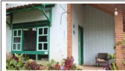
Gambar 1. Homestay warga tampak depan

Setelah kegiatan wawancara terbuka, dilaksanakan diskusi terfokus dengan elemen kelompok pemuda. Pemuda dimaksud adalah Nabil yang memahami potensi atraksi wisata di Kemuning Lor dan memiliki minat mengeksplorasi daya Tarik desa. Nabil tinggal di dusun rayap desa kemuning Lor berada di dekat peternakan sapi perah milik pemerintah Kabupaten Jember. Materi diskusi diarahkan pada kelompok atau anggota masyarakat desa yang memiliki rumah yang disewakan, ketertarikan masyarakat desa untuk memperoleh penghasilan alternative dari rumah inap desa merupakan salahsatu bagian dari fasilitas yang harus ada pada desa wisata, dan motif masyarakat