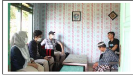
Gambar 3. Fokus Grup Terarah Pengembangan Homestay

Tujuan yang telah ditetapkan menyusun rencana yang mempertimbangkan kemampuan warga desa dalam: teknologi yang dapat mendukung dan mempermudah, kemampuan kelompok kepentingan yang dapat diajak bermitra, Lingkungan social budaya dan pembiayaan yang diperlukan. Dengan mempertimbangkan hal tersebut maka dokumen rencana kegiatan ditetapkan untuk dilaksanakan.