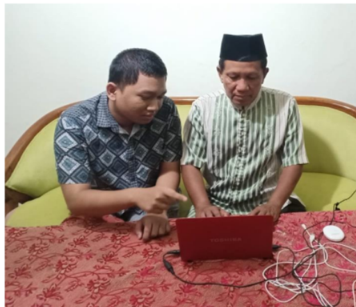
Gambar 2. Kegiatan pendampingan pembuatan arus kas masjid

Dalam prosesnya tidak ada kendala berarti dikarenakan bendahara masjid cepat memahami dan mempraktekkan input setiap kas keluar dan masuk. Bendahara perlu membiasakan diri menggunakan program windows excel bagi penyusunan informasi keuangan dan memahami siklus akuntansi. Masukan dari tim pengabdian untuk melakukan input menggunakan excel disetujui oleh bendahara akan tetapi dalam prakteknya bendahara juga tetap melakukan input manual menggunakan buku folio hardcover sehingga bendahara masjid melakukan dua kali pencatatan yaitu secara manual maupun dengan excel.