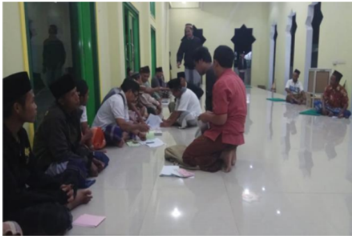
Gambar 1: Pemaparan materi manajemen pengelolaan masjid

Latar belakang pendidikan takmir masjid yang bermacam-macam mulai dari yang lulusan sekolah dasar hingga sarjana tentunya menjadi kendala bagi tim pengabdian untuk memberikan pemahaman akan materi yang diberikan. Tim pengabdian tetap berusaha seoptimal mungkin hingga takmir bisa memahami materi yang disampaikan dengan berbagai upaya diantaranya menggunakan Bahasa Madura untuk membuat paham takmir yang mayoritas berbahasa Madura dalam komunikasi sehari-hari.