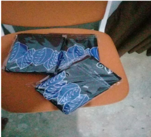
Gambar 2. Kemasan Batik Sekar Arum

Setelah proses cap, kain batik akan diberikan warna, pelorotan malam hingga pengeringan. Batik yang telah jadi dan siap untuk dipasarkan akan dibungkus dengan plastik untuk kemasan. Berikut kemasan plastik batik cap merk sekar arum.