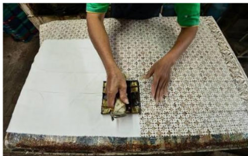
Gambar 1. Proses Pembatik Menggunakan Canting Cap

Pewarnaan batik sekar arum ada 2 macam yaitu warna sintetis dan ada warna alam. Keunggulan pemilihan warna sintetis bagi pengrajin adalah warna mudah dicari dan keunggulan bagi pembeli adalah harga batik akan lebih murah dengan kualitas cukup baik. Keunggulan batik menggunakan warna alam bagi pembeli adalah warna tetap awet tidak pudar, dan terlihat klasik, namun harga warna alam adalah lumayan mahal. Batik sekar arum rata-rata mampu memproduksi 20 kain dalam waktu seminggu, yang dilakukan oleh 4 orang sampai proses pengeringan batik. Pada tempat produksi batik ini terdapat bak pewarnaan sintetis, 2 bak pewarnaan alam, bak lorot dan bak pencucian akhir batik. Berikut foto produksi batik menggunakan canting cap dari tembaga.