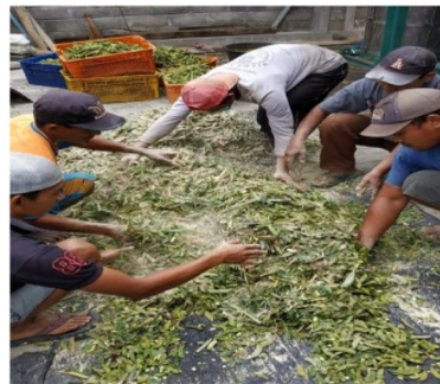
Gambar 2. Suasana Kegiatan Pelatihan Pembuatan Silase Ransum Komplit

Para peternak mitra juga sangat antusias dalam mengikuti pelatihan silase ransum komplit dan banyak pertanyaan terkait bahan aditif yang digunakan yaitu dedak padi dan pati dari biji pada tanaman jagung utuh. Bahan aditif yang ditambahkan bukan menjadi satu-satunya faktor penentuan dalam keberhasilan pembuatan silase ransum komplit. Faktor lainnya adalah kualitas bahan pakan yang digunakan dan ketepatan proses selama pembuatan.