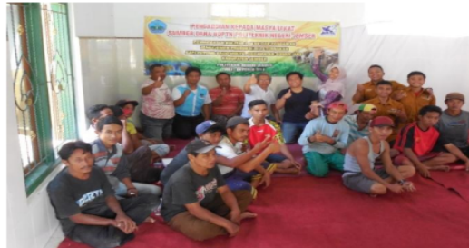
Gambar 1. Dokumentasi pada Saat Kegiatan Penyuluhan

mengenai teknologi penyimpanan pakan, formulasi dan pembuatan ransum komplit serta manajemen produksi melalui konsep efisiensi biaya, waktu dan tenaga dalam menjalankan peternakan sapi potong. Para peternak anggota mitra sangat antusias dalam mengikuti kegiatan penyuluhan. Pada saat diskusi banyak membahas terkait silase dan probiotik, formulasi pakan dan efisiensi produksi. Hal tersebut menunjukkan bahwa peternak anggota mitra sangat berkeinginan untuk memperbaiki manajemennya dalam beternak yang dilakukan selama ini dan berkeinginan untuk mengembangkan usaha peternakan yang dilakukan dalam kelompok.