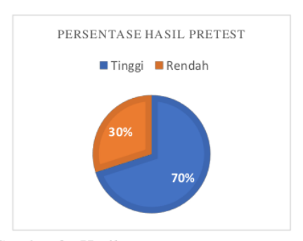
Gambar 3. Hasil pre test peserta mengenai yoghurt dan cara pembuatannya

Hasil pre test menyatakan bahwa mayoritas (sekitar 70%) responden masih memiliki tingkat pengetahuan yang kurang mengenai yoghurt dan pembuatannya (Gambar 3)