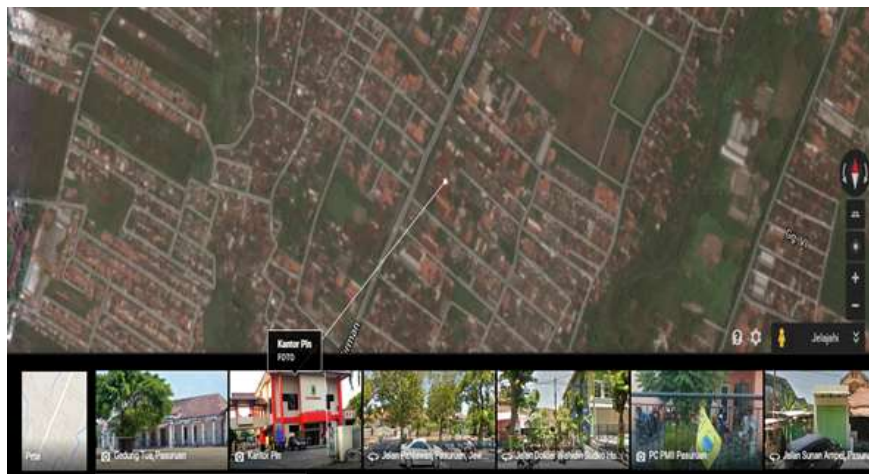
Gambar 1.1 Denah Lokasi PT. PLN (Persero) Area Pasuruan.

Lokasi pelaksanaan Praktek Kerja Lapangan (PKL) adalah di PT. PLN (Persero) Area Pasuruan, Jl. Panglima Sudirman No. 69 Pasuruan. Dibawah ini merupakan denah lokasi pelaksanaan Praktek Kerja Lapangan (PKL).