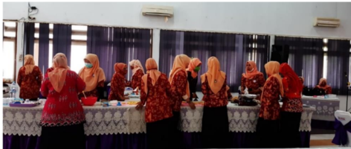
Gambar 3. Peserta Pelatihan Menempati Meja sesuai Kelompoknya

Kegiatan pelatihan diawali dengan memberikan penjelasan tentang potensi gizi pada udang dan labu kuning, sehingga baik digunakan sebagai bahan dasar maupun tambahan pembuatan produk olahan pangan. Peserta sangat antusias mendengarkan penjelasan yang diberikan pemateri. Peserta pelatihan dibagi menjadi 7 kelompok dengan jumlah setiap kelompok antar 10 sampai 11 peserta. Pembagian kelompok dimaksudkan agar pelatihan yang diajarkan bisa lebih efektif dan mudah dipahami. Setiap kelompok difasilitasi dengan meja panjang untuk melakukan proses pembuatan produk. Bahan dan peralatan yang digunakan untuk pelatihan sudah disiapkan.