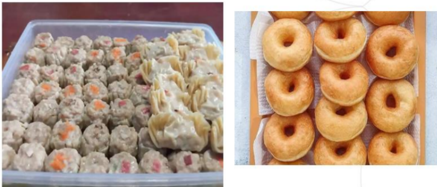
Gambar 5. Siomay dan Donat Labu Kuning Dibiarkan Dingin Sebelum Dikemas

Setelah pembuatan siomay dan donat labu kuning selesai dilakukan, selanjutnya peserta diajari cara mengemas produk dengan cara vakum sehingga siap dibekukan sebagai produk frozen food . Pada tahap ini, peserta diberikan penjelasan dan demo mengenai pemilihan kemasan untuk proses vakum dan pembekuan. Selain itu juga dijelaskan label pangan yang perlu dicantumkan pada produk frozen food .