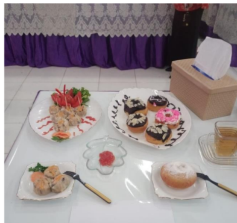
Gambar 6. Salah Satu Hasil Pelatihan Pembuatan Siomay dan Donat Labu Kuning

Hasil pelatihan yang berupa siomay dan donat labu kuning dipresentasikan oleh masing-masing peserta dengan cara mendisplay pada meja yang telah disiapkan. Peserta dibebaskan berkreasi dalam mempresentasikan produk hasil pelatihannya. Salah satu hasil pelatihan yang dipresentasikan disajikan pada Gambar 5.