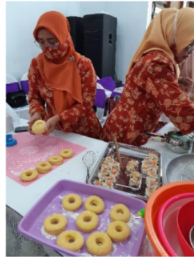
Gambar 4. Peserta Membuat Donat Labu Kuning dan Siomay

Dengan dipandu pemateri, peserta diajari tahap demi tahap pembuatan donat labu kuning dan siomay. Proses pelatihan berlangsung interaktif antar pemateri dengan peserta. Pemateri mengajari setiap pertanyaan peserta dengan telaten dan sabar, dengan harapan semua peserta berhasil membuat donat labu kuning.