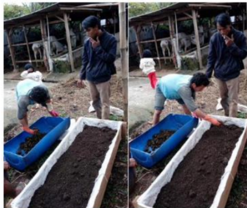
Gambar 2. Pembuatan media ternak cacing tanah

dalam setiap tray/biopond. Setelah tahap ini selesai peternak menerima pelatihan cara merawat cacing tanah. Selama pemeliharaan peternak cukup menjaga kelembapan media dan menambahkan sisa pakan ternak untuk dijadikan pakan koloni cacing tanah. Menjaga kelembapan media cacing penting untuk dilakukan agar cacing tumbuh dengan baik. Saat pembuatan vermikompos, penurunan nisbah C/N, kelembapan, temperatur dan pH bahan media secara periodik sangat berkaitan dengan kondisi hidup dan perkembangan cacing tanah serta indikasi terjadinya proses pengomposan [6]. Pemanenan cacing bisa dilakukan 4 minggu setelahnya.