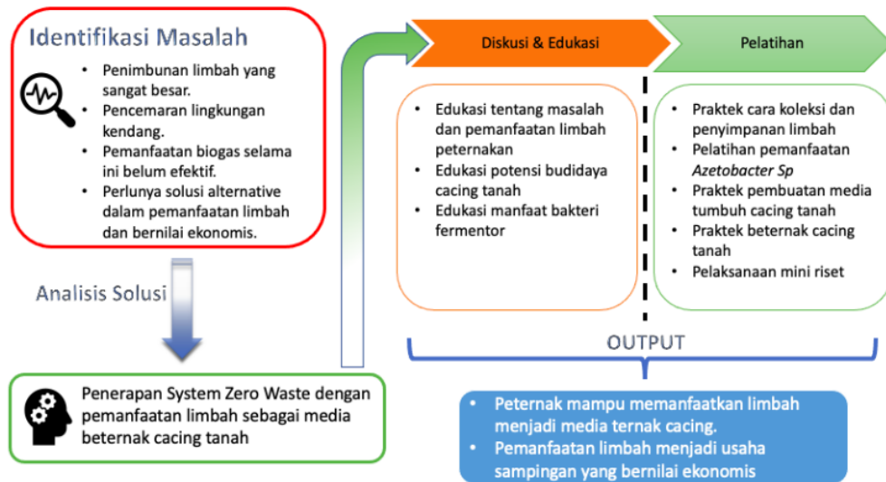
Gambar 1. Skema Analisa Permasalahan