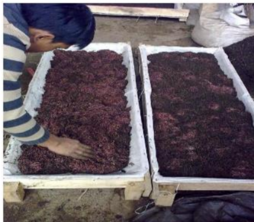
Gambar 3. Proses panen cacing tanah