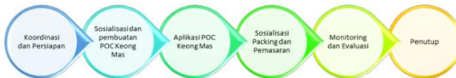
Gambar 1. Skema Tahapan Pelaksanaan Pengabdian

Pelatihan pembuatan dan aplikasi POC keong mas bersifat fleksibel menyesuaikan waktu luang yang disepakati dengan pihak mitra, bersifat praktis agar mudah dipahami dan dilakukan oleh para petani, dan bersifat ekonomis karena sebagian besar mitra dari kalangan menengah kebawah. Mitra yang berjumlah 10 orang kita bekali tentang pentingnya menjaga produktivitas tanah dengan menambahkan bahan organik ke lahan pertanian, dan kita bekali juga dengan pembuatan pupuk organik cair yang berbahan dasar keong mas. Adapun tahapan pelaksanaan kegiatan tertera pada gambar berikut.