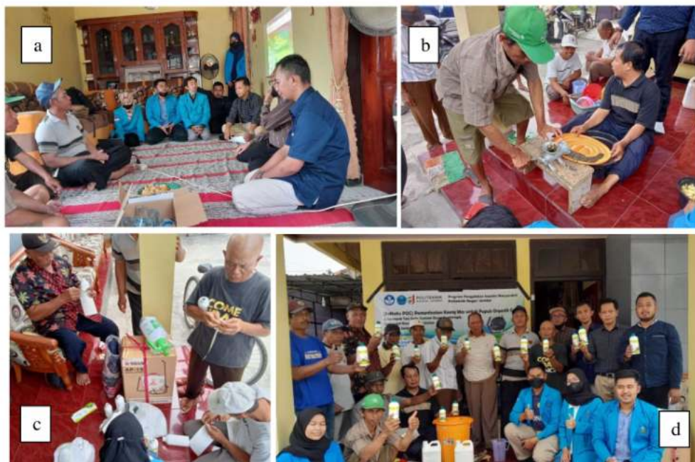
Gambar 2. a) Kegiatan penyuluhan teori; b) Proses penggilingan Keong Mas untuk bahan POC; c) Proses pengemasan POC; d) Hasil produk yang telah dikemas