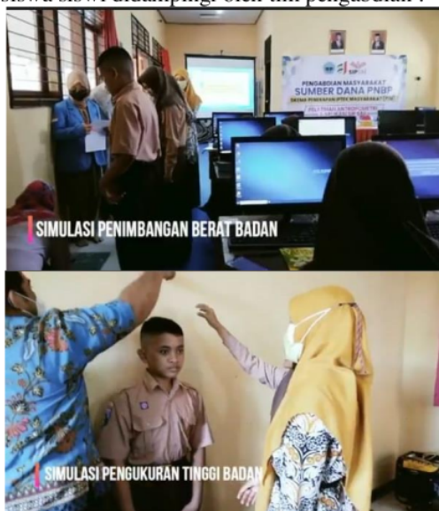
Gambar 6 Simulasi penimbangan berat badan dan tinggi badan

Setelah pemutaran video, siswa siswi SMP 2 Arjasa ini diminta untuk melakukan simulasi pengukuran, ada yang bertindak sebagai petugas UKS dan siswa yang diukur. Dalam simulasi siswa siswi didampingi oleh tim pengabdian .