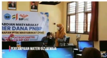
Gambar 3 Presentasi Materi Penyuluhan Gizi Remaja dan alternatif makanan tambahan untuk anak sekolah

Penyuluhan dengan materi gizi remaja pernah dilakukan di SMP Bandar Lampung [9]. namun belum ada yang mengaitkan dengan status gizi. Pada pengabdian di SMP 2 Arjasa ini kami memberikan penyuluhan tentang gizi seimbang, alternatif makanan tambahan untuk anak sekolah, dan pentingnya pemantauan status gizi remaja. Kegiatan ini dihadiri oleh 15 orang peserta atau sebesar 100% kehadiran. Materi yang disampaikan ada 2 sesi yaitu. Metode yang digunakan adalah penyampaian materi melalui ceramah dan dilanjutkan dengan diskusi terbuka.