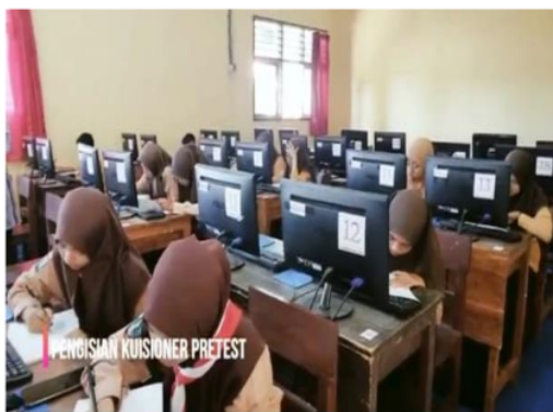
Gambar 4 Pengisian Kuesioner Kegiatan Penyuluhan

Setelah penyuluhan pengurus UKS memperoleh nilai rata-rata 75,6 . Jika nilai tersebut dilakukan analisa statistic paired T tes maka akan dihasilkan nilai sig 0,000 artinya berbeda signifikan karena nilai p < 0,05 . Hal ini menunjukkan bahwa penyuluhan tentang gizi remaja dan alternative makanan tambahan mampu meningkatkan pengetahuan siswa. Hal ini sejalan dengan penelitian yang dilakukan oleh nasihah tahun 2016 [10]. Penelitian tersebut menyatakan penyuluhan gizi dapat meningkatkan pengetahuan dan sikap siswa dalam memilih jajanan. Antusiasme peserta sangat tinggi dibuktikan dengan saat penyuluhan banyak pertanyaan ataupun tanggapan yang dilontarkan peserta terkait dengan materi yang disampaikan. Komunikasi dapat terjalin dua arah saat diskusi.