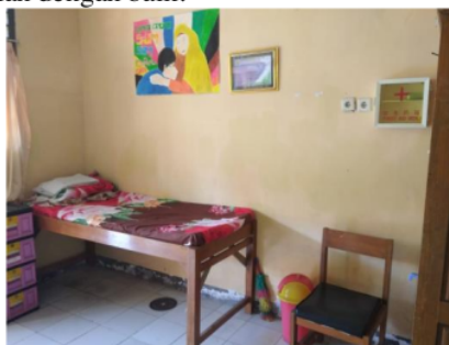
Gambar 1 Kondisi Unit Kesehatan Sekolah (UKS) di SMPN 2 Kemuning Lor

KEK dapat dicegah dengan pemantauan status gizi pada remaja putri sebagai calon ibu yang dilakukan sejak di sekolah. Pemantauan ini dilakukan oleh Unit Kesehatan Sekolah (UKS) dengan mengukur antropometri pada siswa putri. Hasil wawancara dengan Kepala Sekolah dan Pembina UKS di SMPN 2 Kemuning Lor, selama ini UKS sudah melakukan penimbangan berat badan dan pengukuran tinggi badan, namun belum ada penentuan status gizi. Petugas UKS belum mengetahui cara penentuan status gizi dan fungsi status gizi tersebut. Pada sekolah tersebut juga belum pernah mendapat penyuluhan gizi. Selama ini, UKS hanya difungsikan sebagai tempat istirahat sementara bagi siswa yang sakit. Fungsi UKS sebagai pendidikan dan pelayanan kesehatan belum berjalan dengan baik.