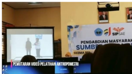
Gambar 5 pemutaran video pelatihan antropometri

Pelatihan antropometri bertujuan agar siswa mampu melakukan pemantauan status gizi secara berkala. Pentingnya pemantauan status gizi sesuai dengan penelitian yang dilakukan warida 2021 adalah agar siswa mampu mengevaluasi pola makan apakah sudah sesuai dengan pedoman gizi seimbang [11]. Pelatihan pengukuran antropometri yang diawali dengan memperhatikan video tutorial pengukuran berat badan menggunakan timbangan digital dan pengukuran tinggi badan dengan stature meter.