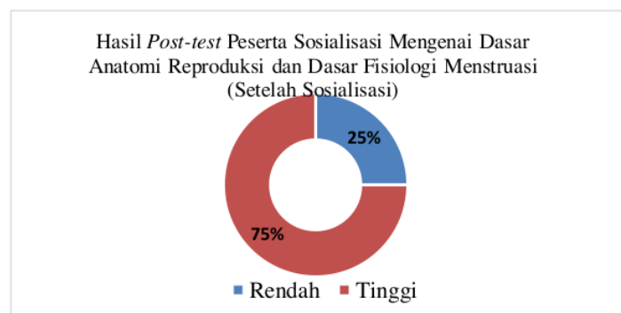
Gambar 4. Hasil Post-test Peserta Sosialisasi Mengenai Dasar Anatomi Reproduksi dan Dasar Fisiologi Menstruasi