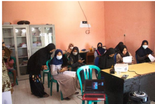
Gambar 1. Peserta sosialisasi sedang mengerjakan soal pre-test

Pada tahap pre-test dan post-test , peserta diberikan pertanyaan tertulis mengenai dasar anatomi reproduksi (5 soal) dan dasar fisiologi menstruasi wanita (5 soal). Adapun post-test yang diberikan terdiri dari 2 tahap yaitu, post-test setelah sosialisasi dan post-test setelah peserta menggunakan aplikasi simen. Hal ini dilakukan untuk mengetahui tingkat pemahaman peserta sebelum dan sesudah menggunakan aplikasi simen.