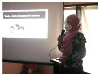
Gambar 3. Pemateri sedang memberika edukasi mengenai dasar anatomi reproduksi dan dasar fisiologi menarche

Berdasarkan gambar 1, hasil pre-test menunjukkan bahwa peserta sosialisasi sebagian besar memiliki tingkat pemahaman yang rendah mengenai dasar anatomi reproduksi dan dasar fisiologi menstruasi wanita (70%). Adapun hal ini dimungkinkan karena ada beberapa istilah yang baru mereka ketahui pertama kali pada pre-test tersebut.