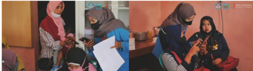
Gambar 6. Peserta sosialisasi sedang menggunakan aplikasi pendidikan kesehatan reproduksi dipandu mahasiswa