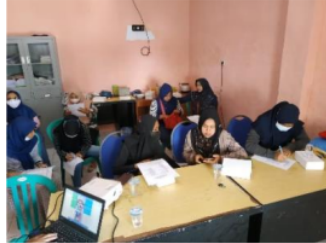
Gambar 5. Peserta sosialisasi sedang mengerjakan soal post-test setelah edukasi mengenai materi menarche

Berdasarkan gambar 2, Hasil post-test setelah sosialisasi menunjukkan bahwa peserta sosialisasi mengalami peningkatan pemahaman mengenai dasar anatomi reproduksi dan dasar fisiologi menstruasi wanita. Tingkat pemahaman peserta yang berkategori tinggi menjadi 75%. Berangkat dari hasil pre-test awal, pemateri dalam sosialisasi ini berusaha menggunakan bahasa yang bisa lebih dimengerti oleh kalangan awam.