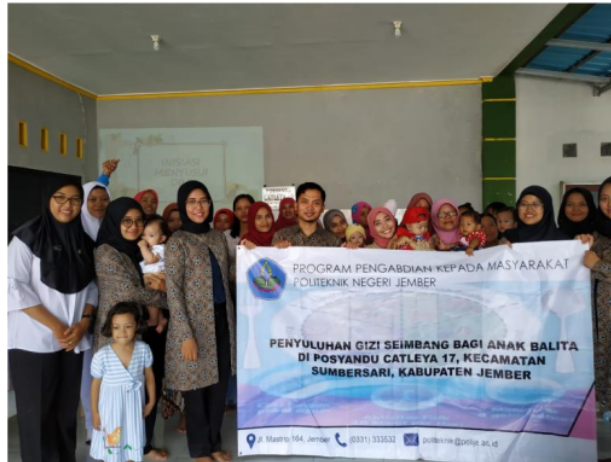
Gambar 4. Foto Bersama Koordinator Bidan, Kader Posyandu dan Peserta Penyuluhan