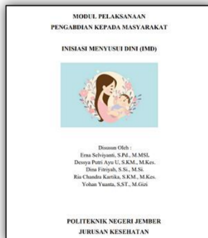
Gambar 3. Modul Inisiasi Menyusui Dini (IMD)

Kegiatan dilanjutkan dengan sesi diskusi dan tanya jawab. Topik yang menjadi perhatian peserta pertama kali adalah dukungan keluarga dalam pemberian ASI. Beberapa peserta dari calon ibu, ibu hamil