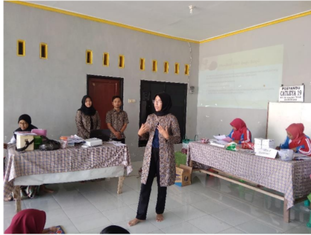
Gambar 2. Pemaparan Materi Inisiasi Menyusui Dini (IMD)

Tim pengabdian masyarakat juga memberikan modul kepada peserta dengan bahasa yang mudah dipahami dan dilengkapi dengan gambar. Adapun isi dari modul inisiasi menyusui dini adalah: