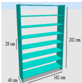
Gambar 1: Rak Besi Terbuka Sesuai Antropometri Petugas Filling

Berdasarkan uraian diatas, maka rak penyimpanan yang sesuai antropometri petugas filling digambarkan sebagai berikut: