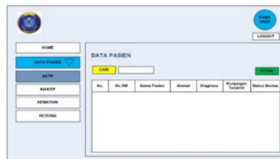
Gambar 3. Halaman Data Berkas Rekam Medis Aktif

Gambar 2 menunjukkan tampilan halaman utama sistem informasi retensi RUMKITAL Dr Ramelan Surabaya, terdapat data peringatan kepada petugas retensi bahwa berkas rekam medis harus di inaktifkan dan retensi. Peringatan inaktif digunakan untuk pemindahan berkas rekam medis yang masih menggunakan kertas dari rak aktif ke rak inaktif. Peringatan retensi digunakan sebagai tanda bahwa berkas rekam medis telah disimpan pada rak inaktif, dilakukan penilaian guna, proses scan , dan dimusnahkan.