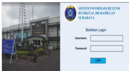
Gambar 1. Halaman Login

Proses retensi berkas rekam medis di RUMKITAL Dr Ramelan Surabaya masih dilakukan secara manual dan belum menggunakan sistem informasi retensi. Unsur machine untuk pelaksanaan retensi berkas rekam medis masih dilakukan secara manual, membuka dan memilah isi berkas rekam medis satu per satu dilihat kunjungan \geq 5 tahun dari rak berkas rekam medis pasien aktif. Sistem informasi retensi RUMKITAL Dr Ramelan Surabaya yang telah dibuat peneliti dapat memudahkan pekerjaan petugas untuk melakukan kegiatan retensi tepat waktu dan tidak adanya penumpukan berkas rekam medis lagi. Hal ini sejalan dengan penelitian Farlinda et al (2017) menyatakan bahwa pembuatan sistem informasi filig terdiri nama, nomor rekam medis, tanggal masuk, tanggal keluar, diagnosa akhir, serta tindakan jika ada agar mempermudah saat pelaksanaan retensi. Peneliti mengusulkan solusi berupa sistem informasi retensi yang telah dibuat oleh peneliti, sebagai berikut :