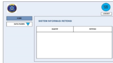
Gambar 2. Halaman Utama Sistem Informasi Retensi

Gambar 2 menunjukkan tampilan halaman utama sistem informasi retensi RUMKITAL Dr Ramelan Surabaya, terdapat data peringatan kepada petugas retensi bahwa berkas rekam medis harus di inaktifkan dan retensi. Peringatan inaktif digunakan untuk pemindahan berkas rekam medis yang masih menggunakan kertas dari rak aktif ke rak inaktif. Peringatan retensi digunakan sebagai tanda bahwa berkas rekam medis telah disimpan pada rak inaktif, dilakukan penilaian guna, proses scan , dan dimusnahkan.