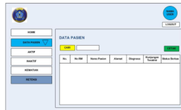
Gambar 6. Halaman Data Berkas Rekam Medik Retensi

Gambar 5 menunjukkan tampilan halaman data berkas rekam medis kematian. Halaman data berkas rekam medis kematian merupakan data pasien yang telah berobat meninggal di RUMKITAL Dr Ramelan Surabaya dan akan disimpan selama 5 tahun. Terdapat tabel yang berisikan nomor rekam medis, nama pasien, alamat, diagnosa, tanggal meninggal dan status berkas. Terdapat kolom pencarian dengan nomor rekam medis dan tombol cetak yang berguna untuk mencetak data pasien tersebut.