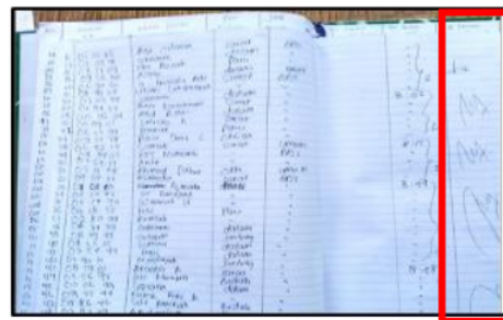
Kolom Waktu Pengembalian

Permasalahan lain yaitu waktu pengembalian dokumen rekam medis dengan melihat kesesuaian pengembalian dokumen rekam medis menggunakan buku ekspedisi tidak terlaksana. Hal tersebut dapat dibuktikan pada Gambar 1.