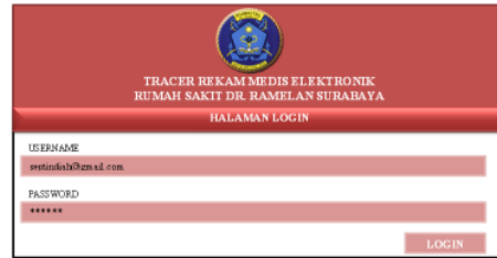
Gambar 3 Halaman login tracer elektronik

Aplikasi tracer rekam medis elektronik ini berdiri sendiri tidak menjadi satu kesatuan dengan SIMRS, dikarenakan aplikasi ini hanya digunakan sebagai penanda bawah rekam medis tersebut keluar dari rak penyimpanan. Untuk dijadikan laporan terkait permintaan file, itu sudah ada pada SIMRS nya sendiri pada menu permintaan file. Untuk halaman login ini petugas memasukkan username dan password yang sama pada saat login untuk SIMRS Dr. Ramelan Surabaya.