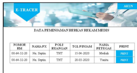
Gambar 5 Halaman data peminjaman berkas rekam medis

Halaman data peminjaman berkas rekam medis akan muncul setelah petugas klik submit pada halaman sebelumnya. Pada halaman ini muncul data peminjaman berkas rekam medis yang berisi nomor rekam medis, nama pasien, nama poli/ruangan yang meminjam nama petugas dan tombol print. Kemudian petugas klik tombol print pada tanggal saat itu pasien mendaftar dan berkunjung ke poli tersebut.