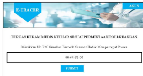
Gambar 4 Halaman scan barcode nomor rekam medis

Pada halaman penginputan nomor rekam medis yang keluar atau sesuai dengan permintaan poli/ruangan petugas hanya melakukan scan barcode nomor rekam medis yang terletak di depan map berkas rekam medis, jika nomor rekam medis muncul pada kolom kemudian klik submit.