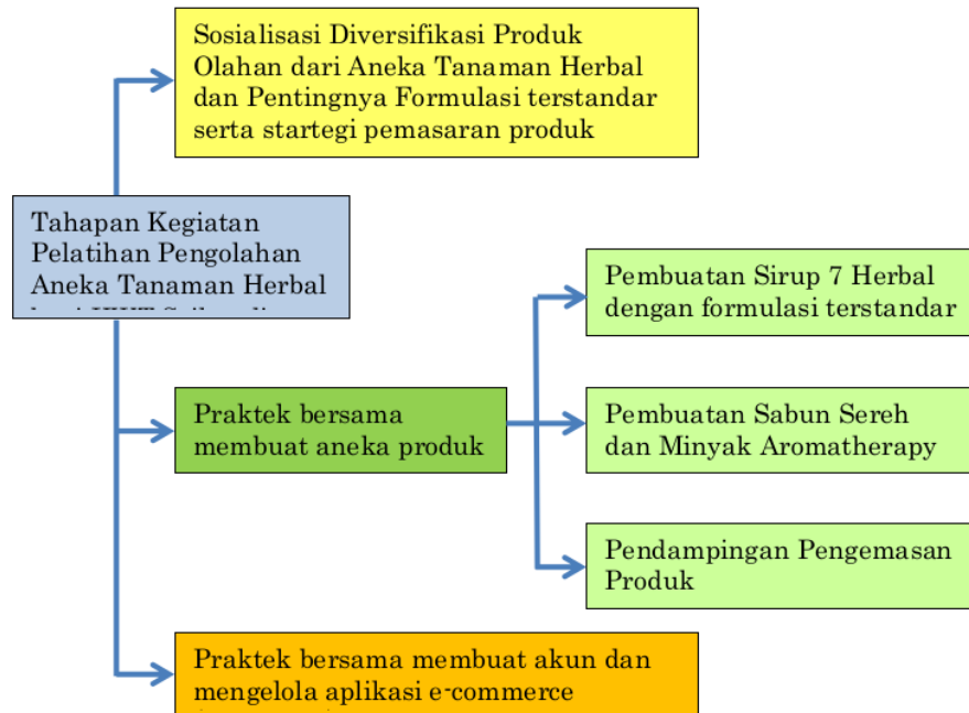
Gambar 1. Tahapan Kegiatan Pelatihan Pengolahan Aneka Tanaman Herbal

Monitoring dilakukan melalui pre- test dan post- test pada saat kegiatan dan setelah kegiatan, sedangkan evaluasi dilakukan secara berkala baik komunikasi secara online maupun berkunjung secara langsung (offline).