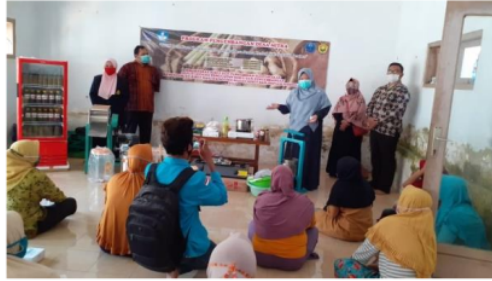
Gambar 2. Kegiatan Sosialisasi Pengolahan Aneka Produk Herbal dan Pemasaran