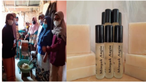
Gambar 4. Praktek Pembuatan Sabun Sereh dan Minyak Aromatherapy