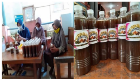
Gambar 5. Proses Pengemasan Sirup 7 Herbal

Kemasan awal untuk produk sirup jahe yang dimiliki KWT Srikandi ialah berbahan gelas sehingga harga jual produk menjadi mahal. Dari pelatihan ini dikenalkan aneka kemasan plastik yang aman untuk produk minuman atau sirup dan dengan harga yang terjangkau sehingga harga jual produk dapat kompetitif. Informasi pada label kemasan juga dilengkapi dari pada semula mulai dari PIRT hingga komposisi. Pada Gambar 5 disajikan proses pengemasan dan produk sirup 7 herbal yang telah dikemas dan diberi label.