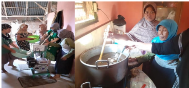
Gambar 3. Praktek Pembuatan Sirup 7 Herbal

Sirup herbal berbahan dasar jahe merupakan produk awal KWT Srikandi, namun formulasinya belum terstandar. Dari kegiatan ini akhirnya ditentukan formulasi standarnya dan bahan dasarnya tidak hanya jahe namun diperkaya dengan kapulaga, sereh, cengkeh, dan lainnya. Proses penggilingan bahan dasar dengan komposisi yang telah ditentukan dan proses pemasakan larutan sirup seperti pada Gambar 3 berikut.