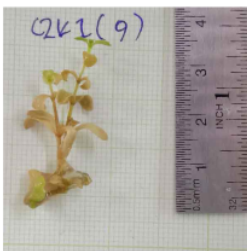
Keterangan: Lampu Warna Merah Biru + Kinetin 2 ppm