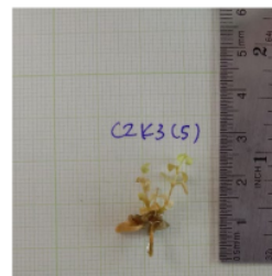
Keterangan: Lampu Warna Merah Biru + Kinetin 3 ppm