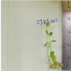
Keterangan: Lampu Warna Putih + Kinetin 2 ppm

pada setiap perlakuan kombinasi pencahayaan lampu LED dan konsentrasi kinetin :