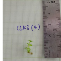
Keterangan: Lampu Warna Putih + Kinetin 4 ppm