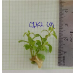
Keterangan: Lampu Warna Putih + Kinetin 3 ppm