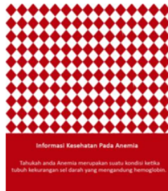
Gambar 3. Kartu flashcard Tampak Belakang

Kotak kartu berbentuk kubus dengan berisikan gambar, nama penyusun, serta logo. Desain kotak kartu flashcard ditampilkan pada gambar 4