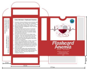
Gambar 4. Kotak kartu Media flashcard

Kotak kartu berbentuk kubus dengan berisikan gambar, nama penyusun, serta logo. Desain kotak kartu flashcard ditampilkan pada gambar 4