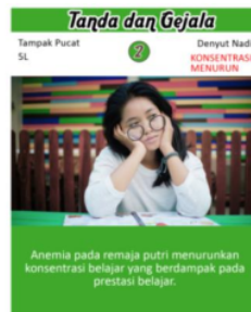
Gambar 2. Kartu Flashcard

Informasi terkait sub topik tentang anemia diperoleh melalui kuesioner dimana beberapa siswi memilih lebih dari satu pilihan jawaban, analisis kebutuhan isi media pembelajaran flashcard tentang anemia merupakan gambaran isi materi yang akan dimasukkan dalam media pembelajaran. Hasil dari desain media flashcard menggunakan aplikasi photoshop Cs3. Isi Media flashcard hasil penelitian ditampilkan pada gambar 2.