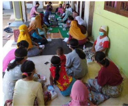
Gambar 1. Kegiatan penyuluhan tentang pengolahan dan pengemasan produk

Kegiatan penyuluhan ini dilakukan dengan tujuan untuk menyampaikan berbagai informasi terkait : a) komoditas kopi, b) bagian-bagian dari buah kopi/ kopi cherry, c) berbagai proses pengolahan kopi seperti pengolahan basah, pengolahan kering, pengolahan semi basah dan pengolahan honey, d) hasil samping/ limbah dari berbagai proses pengolahan kopi, e) pengolahan diversifikasi kopi, f) pengemasan g) pentingnya kemasan yang informatif dan menarik h) labelling .