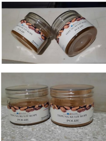
Gambar 2. Hasil produk yang telah dikemas

Kegiatan setelah penyuluhan adalah dilakukannya pendampingan pada peserta tentang pembuatan tepung roti dari kulit kopi dan bagaimana cara mengemas yang baik. Proses pendampingan ini dilakukan dengan cara melakukan praktik langsung pembuatan tepung kulit kopi. Sebelum dilakukan praktik langsung pembuatan tepung roti, peserta diingatkan untuk mengaja kebersihan pada hal-hal yang berkaitan dengan proses seperti mencuci tangan, memakai masker, celemek serta kebersihan alat. Tim pelaksana mengingatkan bahwa kebersihan akan menjadi faktor yang penting dan harus benar-benar diperhatikan. Tepung roti dibuat dengan melakukan beberapa tahapan seperti mencuci kulit kopi, mengeringkannya kemudian menggilingnya menjadi tepung dengan menggunakan blender. Setelah produk jadi, proses selanjutnya adalah produk dikemas di dalam botol plastic yang sebelumnya diberi label dengan berbagai informasi di dalamnya. Gambar 2 adalah penampakan produk tepung roti yang berasal dari kulit kopi dan telah dikemas di dalam wadah botol plastik.