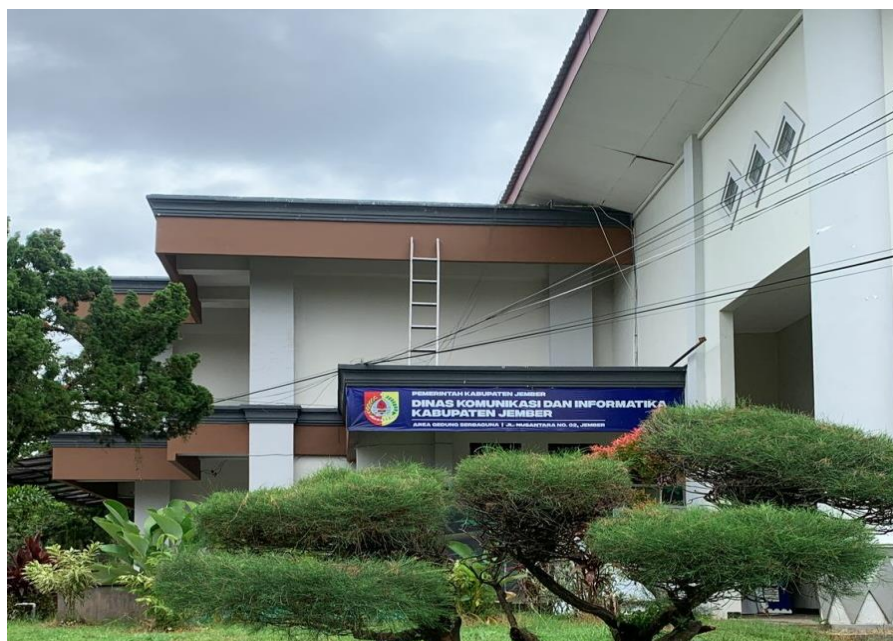
Gambar 1.2 Kantor Diskominfo Jember