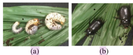
Gambar 2. (a) Larva atau gayas; (b) Imago

Hama kwangwung atau kumbang badak merupakan jenis hama yang menyerang tanaman kelapa di Kecamatan Gumukmas Jember. Hama ini aktif merusak tanaman kelapa pada fase larva (Gambar 1A) atau imago (Gambar 1B).