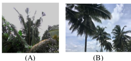
Gambar 3. (a) Serangan hama kwangwung pada tanaman kelapa muda; (b) Pada tanaman kelapa tua

Pengendalian kumbang kwangwung di perkebunan kelapa semakin hari semakin sulit karena kemampuan O. rhinoceros beradaptasi yang tinggi dan banyak toleransi terhadap bahan kimia [6]. Larva kwangwung sudah resisten dengan penggunaan pestisida sehingga hama menjadi semakin sulit untuk dikendalikan dan periode perkembangan larva dapat diperpanjang hingga berbulan-bulan [7]. Hal ini menyebabkan kerusakan signifikan pada pohon kelapa. Erawati et al. [8] melaporkan potensi pengendalian hama dengan memanfaatkan cendawan entomopatogen.