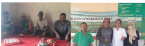
Gambar 4. Edukasi kepada Mitra

Salah satu upaya untuk mengatasi dampak serangan hama kwangwung yang tinggi melalui edukasi kepada petani mitra agar bisa melakukan kegiatan monitoring hama sehingga keberadaan hama dapat diketahui lebih awal dan akan mempermudah upaya pengendalian.