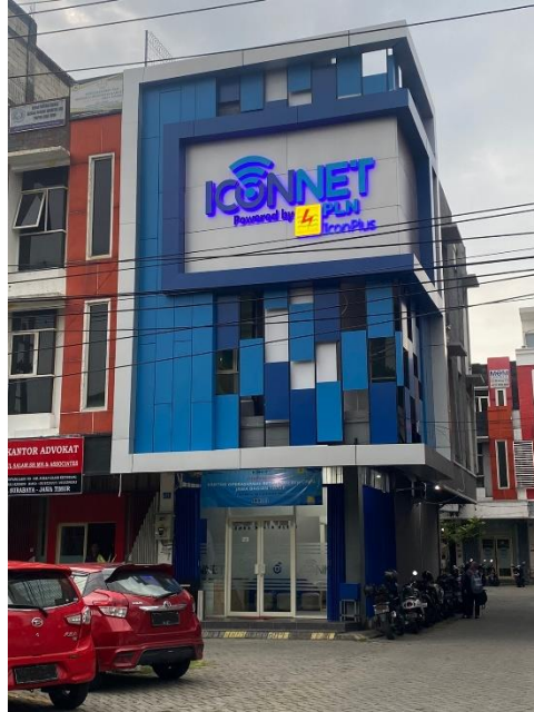
Gambar 1. 2 Gedung Retail PT Indonesia Comnets Plus (PLN Icon Plus) SBU RJBT