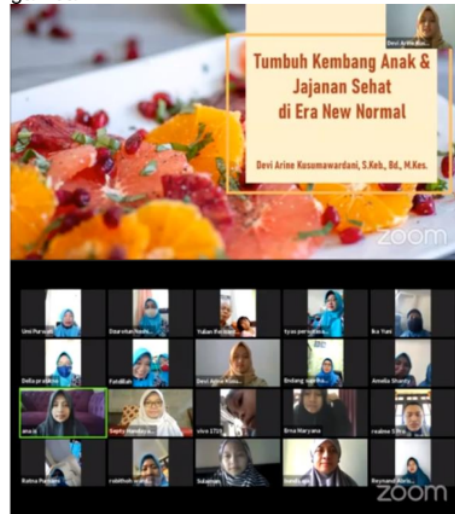
Gambar 1. Sesi edukasi tumbuh kembang anak dan jajanan sehat dengan mitra

yang disampaikan pada sesi edukasi adalah jumlah kasus COVID-19 pada anak, macam-macam jajanan sehat di masa pandemi, dan optimalisasi tumbuh kembang anak selama masa pandemi. Sesi edukasi berlangsung selama kurang lebih 30 menit, setelah sesi edukasi selesai kerucian dilanjutkan dengan sesi diskusi dengan mitra. Selama sesi diskusi, mitra cukup antusias dalam mengajukan pertanyaan. Terdapat 4 pertanyaan yang diajukan yaitu berkaitan tentang macam-macam jajanan sehat untuk anak, kandungan MSG pada jajanan anak, cara memantau tumbuh kembang anak selama masa pandemi, serta cara membuat jajanan sehat pada masa pandemi. Sesi edukasi dapat dilihat pada gambar 1.