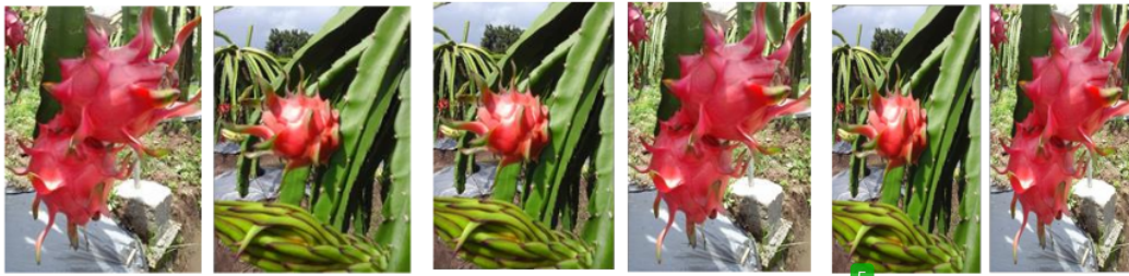
Gambar 2. Aplikasi Sistem Drip Irrigation, Teknik Penyinaran dan Hasil Buah Naga di CV Naura Farm

Kegiatan pengabdian masyarakat 5 yang dilakukan di CV Naura Farm selain memberikan solusi untuk mengatasi kecukupan air dalam budidaya buah naga dan mensiasati panen buah di luar musim panen juga memotivasi mitra untuk terus semangat meningkatkan hasil panennya sehingga usahanya benar-benar berkelanjutan dan memberikan keuntungan yang memadai.