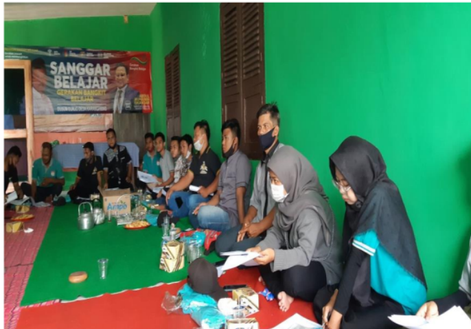
Gambar 2. Peserta kegiatan pengabdian yang sedang menyimak penjelasan pembuatan hand sanitizer

Hasil pelaksanaan kegiatan pengabdian masyarakat dalam upaya peningkatan personal hygiene masyarakat melalui pembuatan hand sanitizer berbahan alami yang dilaksanakan berjalan dengan baik dan dapat diterima masyarakat dengan antusias. Hal ini terlihat dari banyaknya peserta yang hadir di kegiatan sosialisasi terkait pencegahan penularan covid 19. Peserta yang hadir pada kegiatan tersebut mencapai 35 orang. Selama proses sosialisasi peserta banyak bertanya dan berdiskusi seputar pencegahan penularan covid 19, seperti tentang cara mencuci tangan yang benar dan keefektifan penggunaan hand sanitizer sebagai pengganti mencuci tangan apabila tidak menemukan air mengalir.