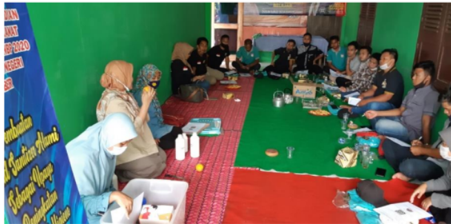
Gambar 3. Tim Pengabdian memberikan penjelasan pembuatan ekstrak kulit jeruk sebagai campuran alami hand sanitizer

Pada saat pelatihan peserta tampak aktif mencoba membuat hand sanitizer dengan bahan yang telah disediakan oleh pelaksana kegiatan pengabdian. Selain itu pada saat proses pelatihan peserta juga bertanya terkait tempat pembelian bahan yang digunakan untuk pembuatan hand sanitizer . Peserta juga berinisiatif untuk menghitung unit cost pembuatan hand sanitizer apabila dibandingkan dengan membeli hand sanitizer di toko.