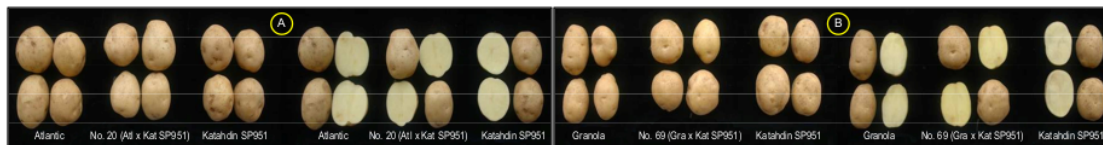
Gambar 2. Fenotipik bentuk dan warna umbi kentang tetua dan PRG silangannya (Herman et al. 2013). A = Atlantic non-PRG, galur silangan Atlantic × Katahdin SP951, dan Katahdin SP951, B = Katahdin SP951, Granola non-PRG, dan galur silangan Granola × Katahdin SP951.

Kandungan anti nutrisi trypsin inhibitor pada umbi Katahdin SP951 adalah 12,43 TIU 2 /mg, Katahdin non-PRG 10,69 TIU 2 /mg, dan galur-galur silangan 8,50–13,93 TIU 2 /mg. Kandungan lektin pada umbi