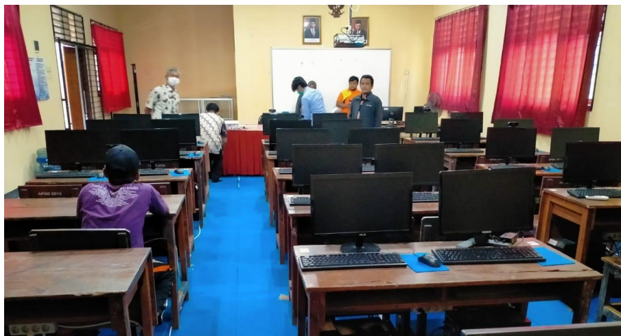
Gambar 4. Ruangan Desiminasi DLP

Diseminasi pengabdian akan mengaplikasikan DLP di SMPN 2 Arjasa, perangkat ini diinstal pada server SMPN 2 Arjasa Desa Kemuning Lor ditunjukkan oleh Gambar 4. Pemilihan ruangan ini sebagai tempat diseminasi mempertimbangkan kemudahan akses, luasnya ruangan, dan tersedianya sumber daya listrik yang mencukupi. Sehingga diharapkan diseminasi ini dapat membawa dampak besar untuk peningkatan proses pembelajaran di SMPN 2 Arjasa Desa Kemuning Lor.