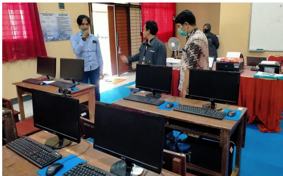
Gambar 2. Ruang Laboratorium Mitra SMPN 2 Arjasa

Justifikasi pengusul bersama mitra dalam menentukan persoalan prioritas yang disepakati untuk diselesaikan: