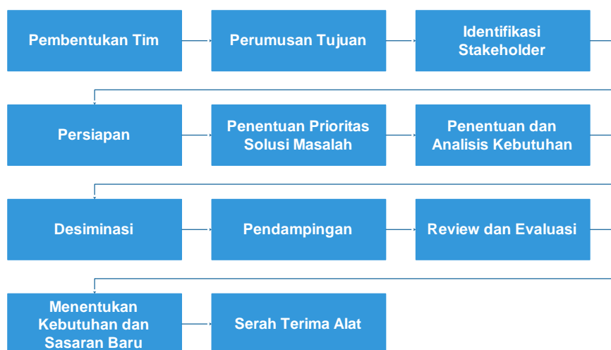
Gambar 1. Tahapan Pengabdian yang Akan Dilaksanakan ( Metode Pelaksanaan Pengabdian Kepada Masyarakat, 2017 )

Adapun metode kegiatan yang akan dilaksanakan melalui kegiatan pengabdian masyarakat PNBPN ini sebagai berikut: