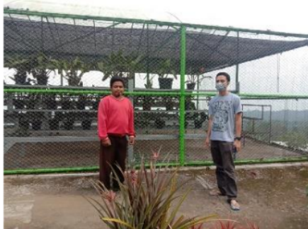
Gambar 2. Small group discussion bersama mitra

Kegiatan pengabdian kemudian dilanjutkan dengan melakukan survey langsung ke lahan petani mitra untuk mengetahui lebih dalam berbagai permasalahan yang ditemukan. Survey ini sekaligus melihat lahan demplot yang digunakan dalam penerapan teknologi. Berdasarkan hasil survey di lahan ditemukan bahwa para petani pada umumnya menanam sayur sayuran di Hidroponik.