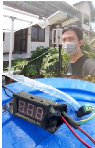
Gambar 5. Pemanfaatan Sinar Matahari Sebagai Sumber Energi

Pembuatan lahan demplot cukup dilakukan di lahan kecil yang tidak menyita banyak tempat. Sehingga efektifitas dari hidroponik sangat tinggi. Selain itu, penggunaan air yang diputar dalam sirkulasi menyebabkan tidak banyak air yang terbuang dengan minimnya penambahan biaya untuk operasionalnya.