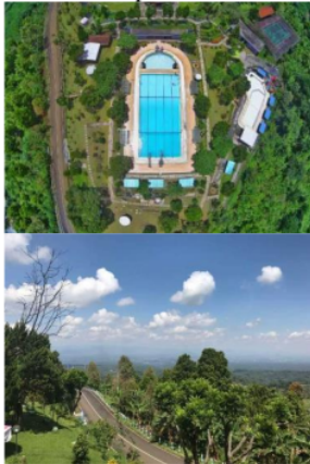
Gambar 1. Pesona pemandangan objek wisata Rembangan

rambutan, durian, apokat, petai, jahe, sengon laut dan kayu mahoni. Produk unggulan yang ada sejauh ini masih banyak yang bersifat musiman, sehingga apabila sedang tidak musim, para petani kebingungan untuk menjual produk pertaniannya dan pendapatan menjadi berkurang. Pada sisi lain, minat para wisatawan untuk datang dan menikmati produk pertanian dengan kualitas yang baik dan minim pestisida untuk dijadikan sebagai oleh-oleh setelah berwisata pemandangan alam puncak rembangan semakin meningkat setiap tahunnya. Oleh karena itu, dibutuhkan adanya penerapan teknologi pertanian modern yang adaptif dan ramah lingkungan serta mudah dilakukan oleh para petani diantaranya melalui penerapan teknologi panel surya dalam otomatisasi sistem hidroponik.