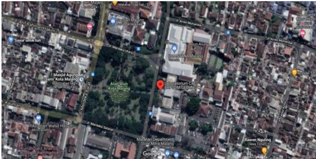
Gambar 1.1 Denah Lokasi Kantor Bupati Malang

Work From Home (WFH) tetapi diwajibkan laporan untuk satu minggu sekali untuk datang ke kantor. Selain itu, dalam pengujian sistem yang telah jadi juga diwajibkan untuk datang ke kantor Bupati Ruang Infrastruktur TIK.