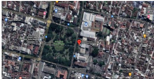
Gambar 1.1 Denah Lokasi kantor Bupati Malang

Adapun denah lokasi kantor Bupati Malang sebagai tempat kegiatan praktik kerja lapangan sebagai berikut.